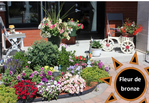
Pierrette Bouchard 2e Rue Est