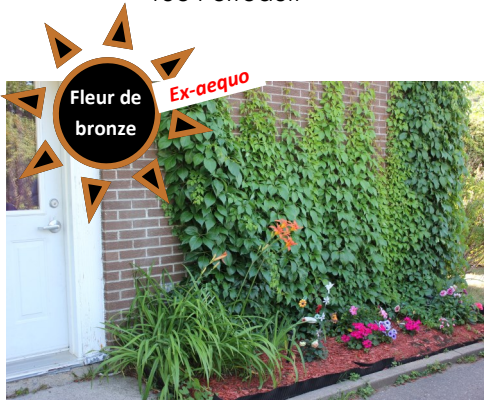
Nancy Ruest rue des Faisans