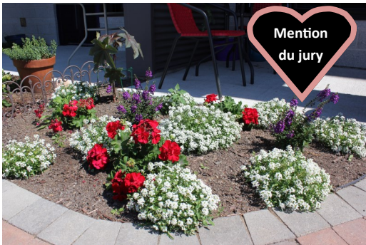
Audrey-Ann Bélanger 2e Rue Est