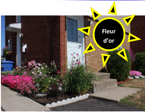
Diane Beaulieu rue Perreault