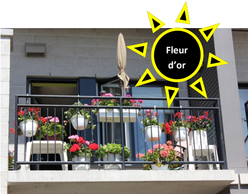
Madeleine Couturier 2e Rue Est