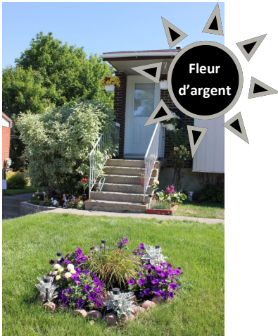
Claire Bouchard rue de Gaspé