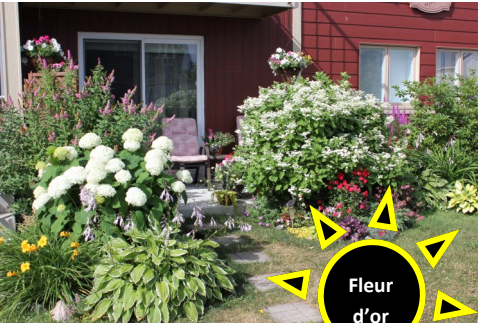
Noëlla D'Auteuil rue Godbout