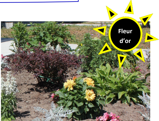
Les habitations de la pointe Gisèle Lechasseur & Rose-Aline Rouleau