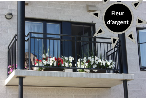
Jeannine Bouillon 2e Rue Est