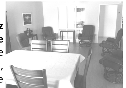
Salon communautaire Appartements du fleuve (Rimouski-Est)

En tant que résident de l'office, vous avez le droit de réserver gratuitement une salle communautaire pour y tenir une activité familiale (anniversaire, baptême, etc), même dans un autre immeuble que celui que vous habitez.